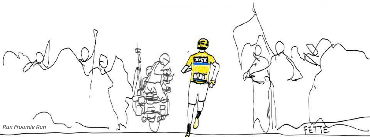
Run Froomie Run